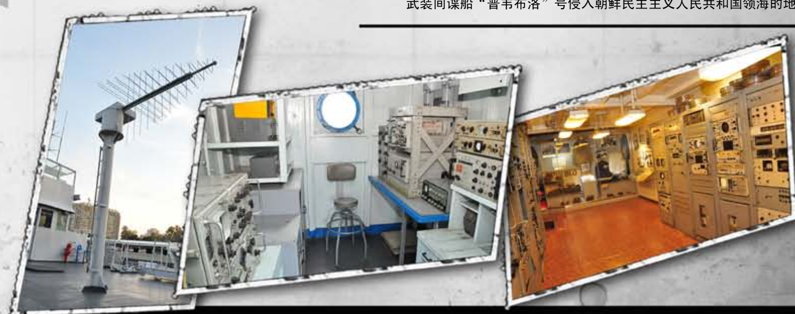
武装间谍船“普韦布洛”号报务室和部分侦察器材