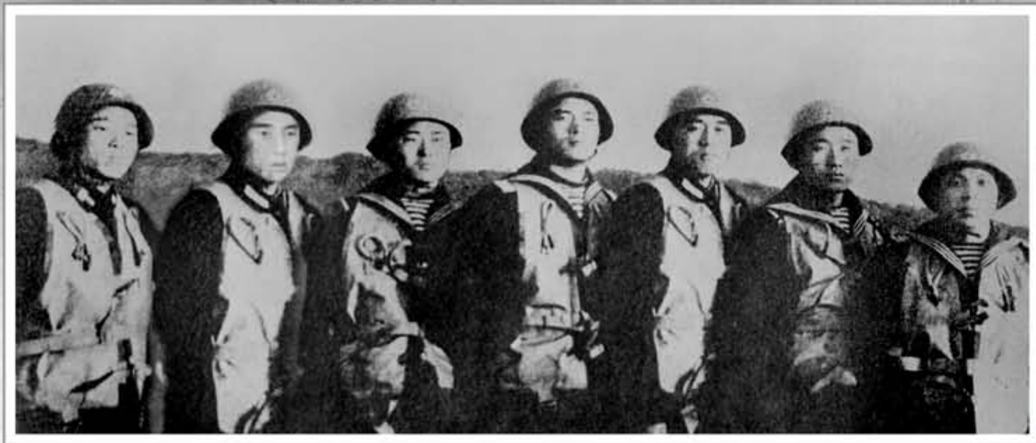
捕获美帝国主义武装间谍船“普韦布洛”号的朝鲜人民军海军

我们海兵被敌人的妄动激怒了，向敌人反击，跳上敌人的船舶，压制反抗的敌人，捕获了船舶。