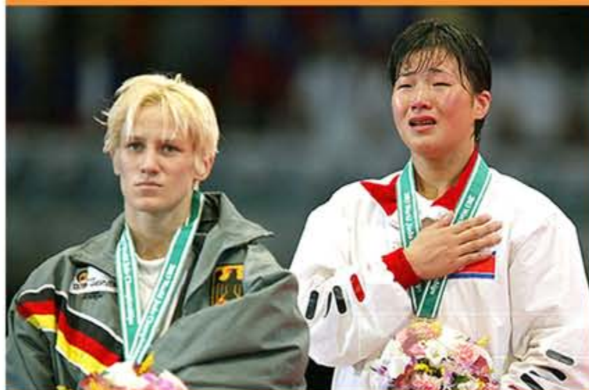
2003年，在世界柔道锦标赛女子57公斤级比赛上获得冠军。