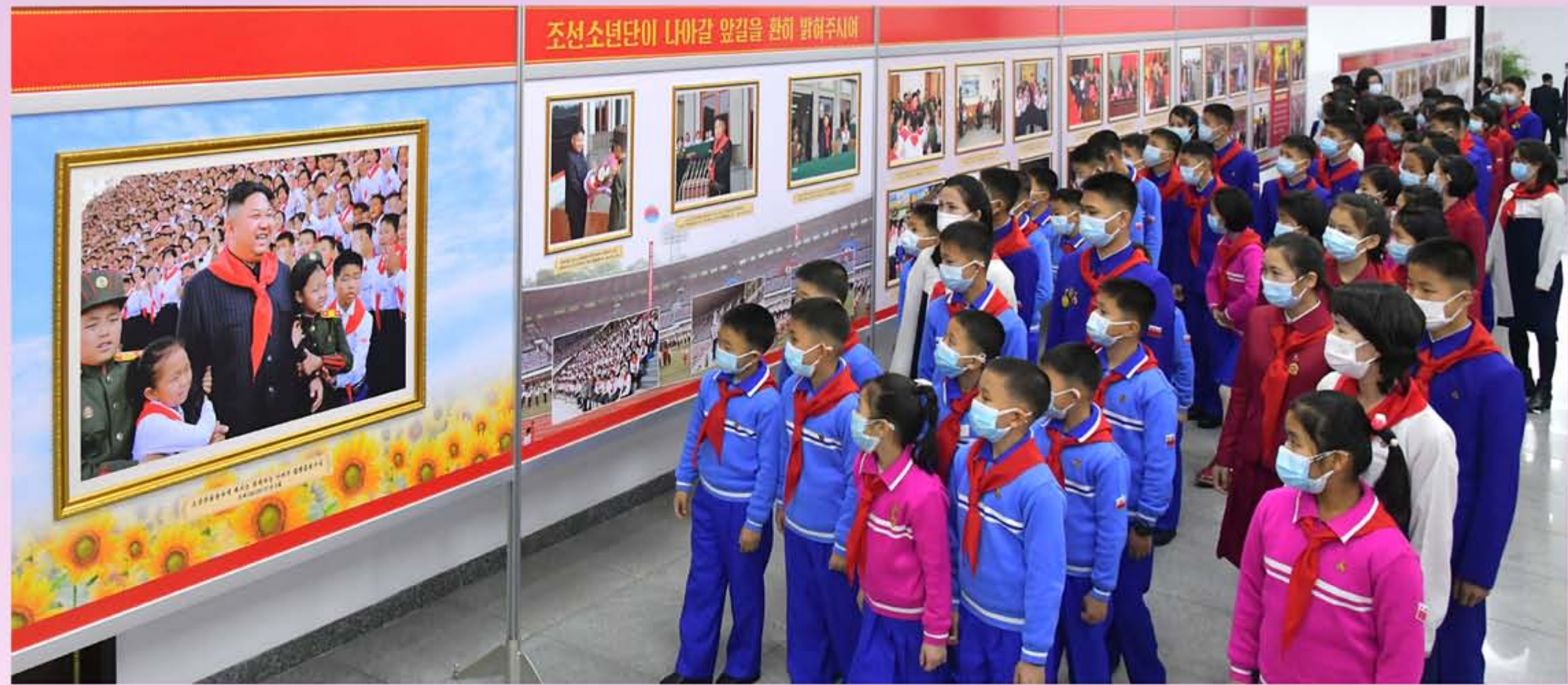
纪念朝鲜少年团第九次代表大会图片展《在伟大太阳的怀抱里光荣和幸福的10年》举行。

他强调，全体少年团员要心怀自己作为光荣的朝鲜少年团一员的骄傲和自豪，飘扬着朝鲜少年团旗和红领巾，坚决准备成为强盛朝鲜的后备队。