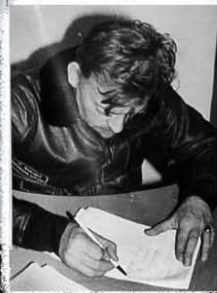
武装间谍船“普韦布洛”号舰长在坦白书中承认：“我坦白招认我们的行为是违反朝鲜停战协定的犯罪行为，确实是侵略行为。”