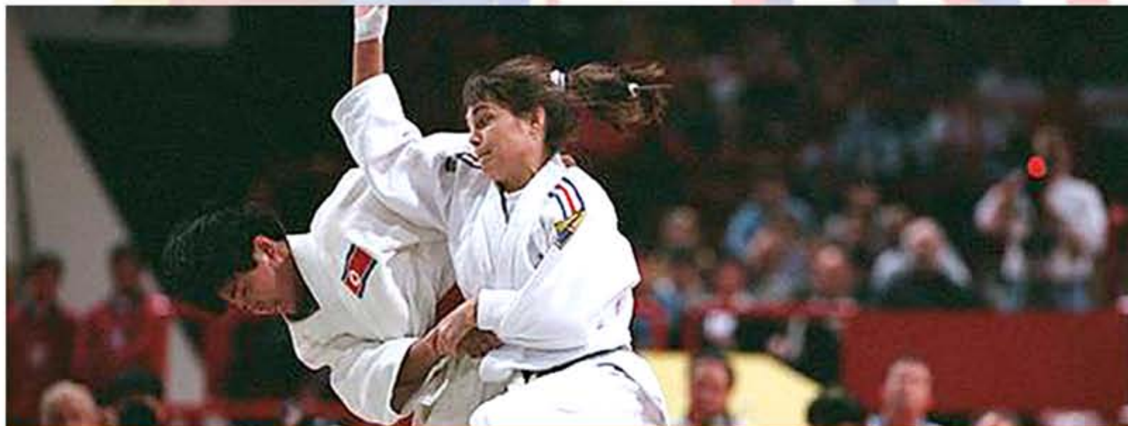
2001年，在世界柔道锦标赛女子52公斤级比赛上获得冠军。