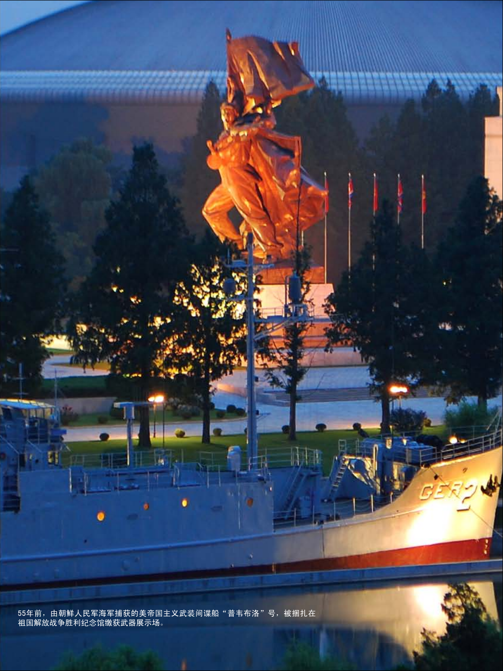
55年前，由朝鲜人民军海军捕获的美帝国主义武装间谍船“普韦布洛”号，被捆扎在 祖国解放战争胜利纪念馆缴获武器展示场。

金正恩同志，进一步加强为无敌的强 军，共和国的尊严和地位提高到更高 的阶段。 如果美国忘记55年前的教训，胆 敢侵犯我国，留下的只有灭亡。 祖国解放战争胜利纪念馆讲解员、 共和国英雄朴仁浩