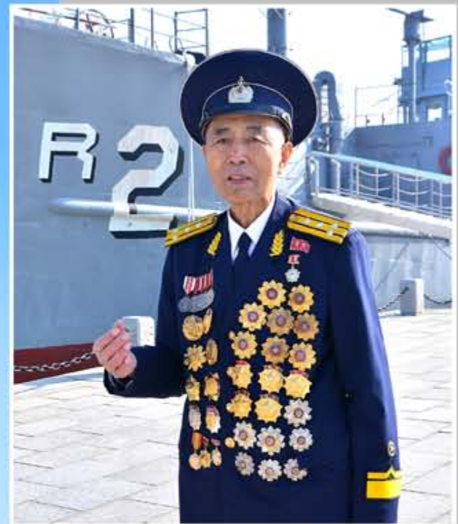
朴仁浩在捕获美帝国主义武装间谍船“普韦布洛”号时任朝鲜人民军海军舰艇搜查组组长，现为祖国解放战争胜利纪念馆讲解员、共和国英雄。