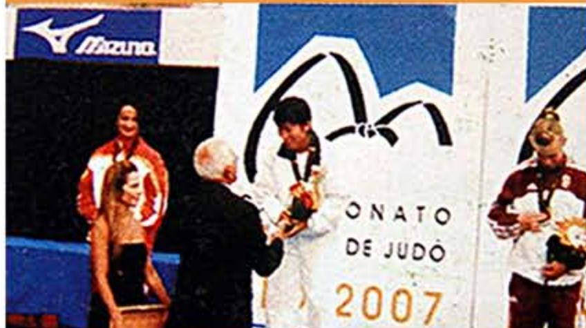
2007年，在世界柔道锦标赛女子57公斤级比赛上获得冠军。