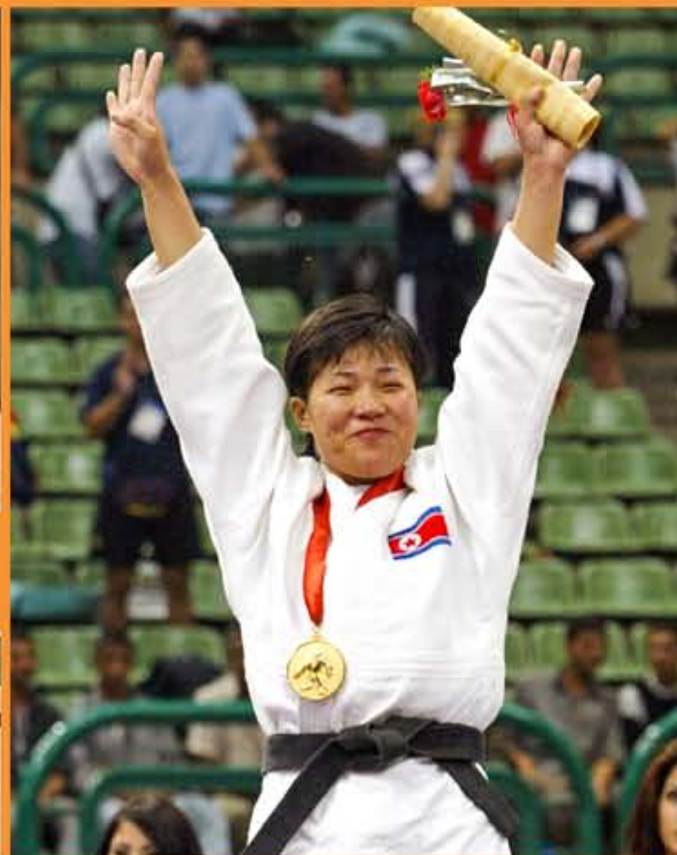
2005年，在世界柔道锦标赛女子57公斤级比赛上获得冠军。