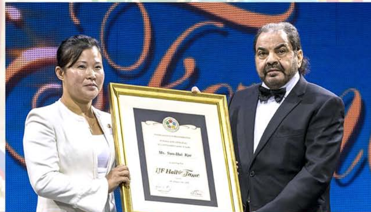
2018年国际柔道联合会向桂顺姬授予世界柔道名人奖。