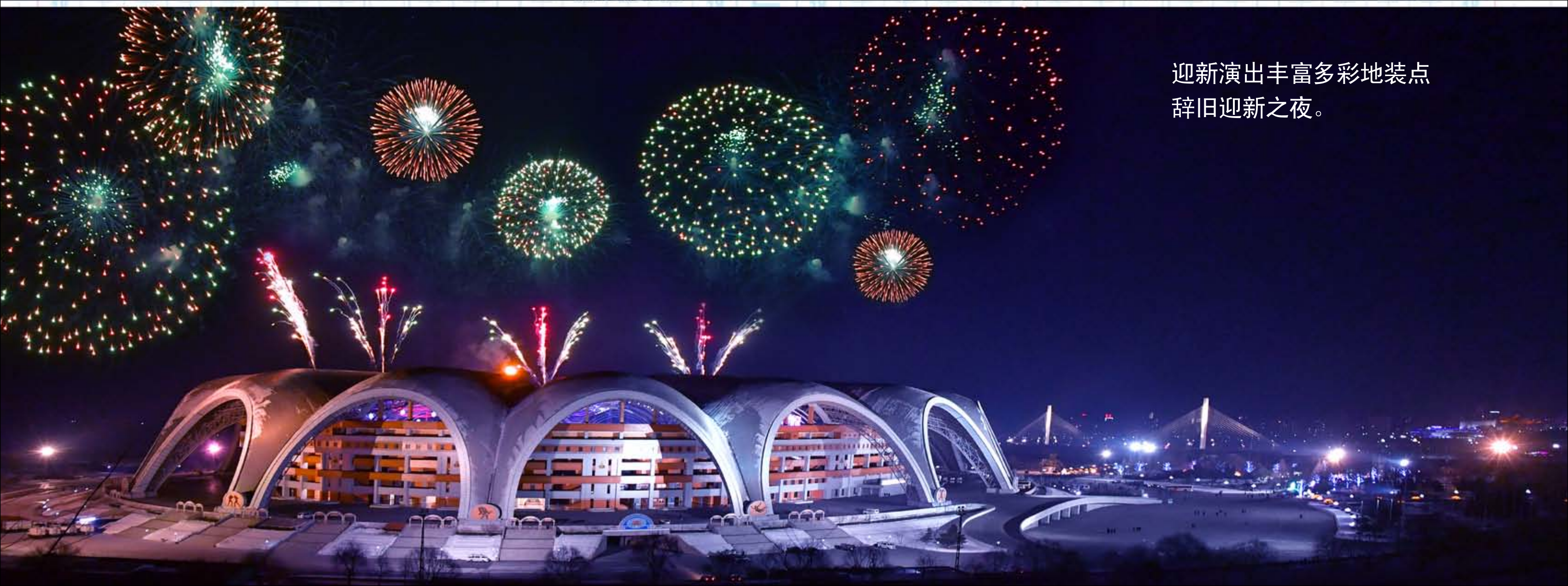
迎新演出丰富多彩地装点 辞旧迎新之夜。