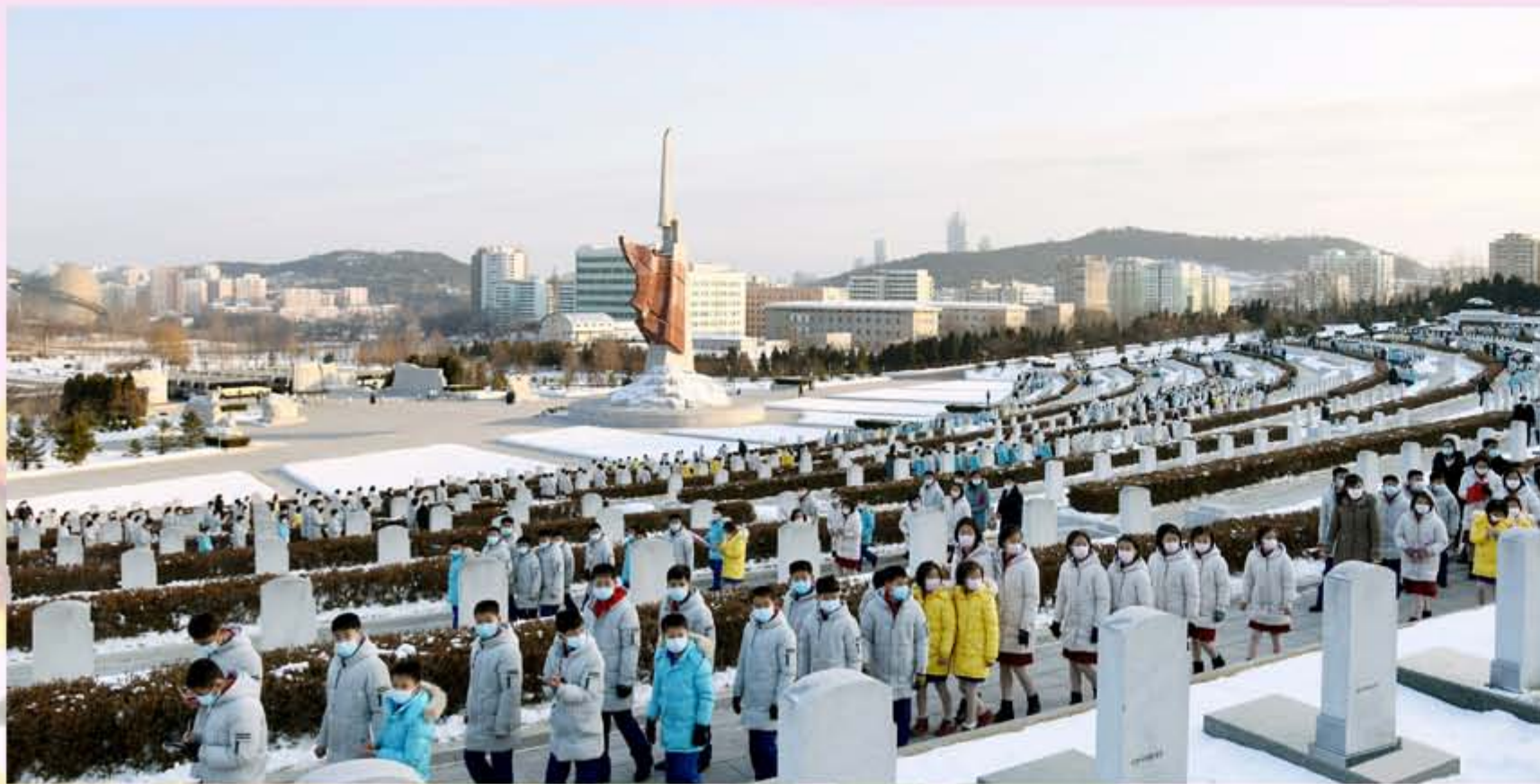
朝鲜少年团第九次代表大会代表参观祖国解放战争烈士陵园和科学技术殿堂。