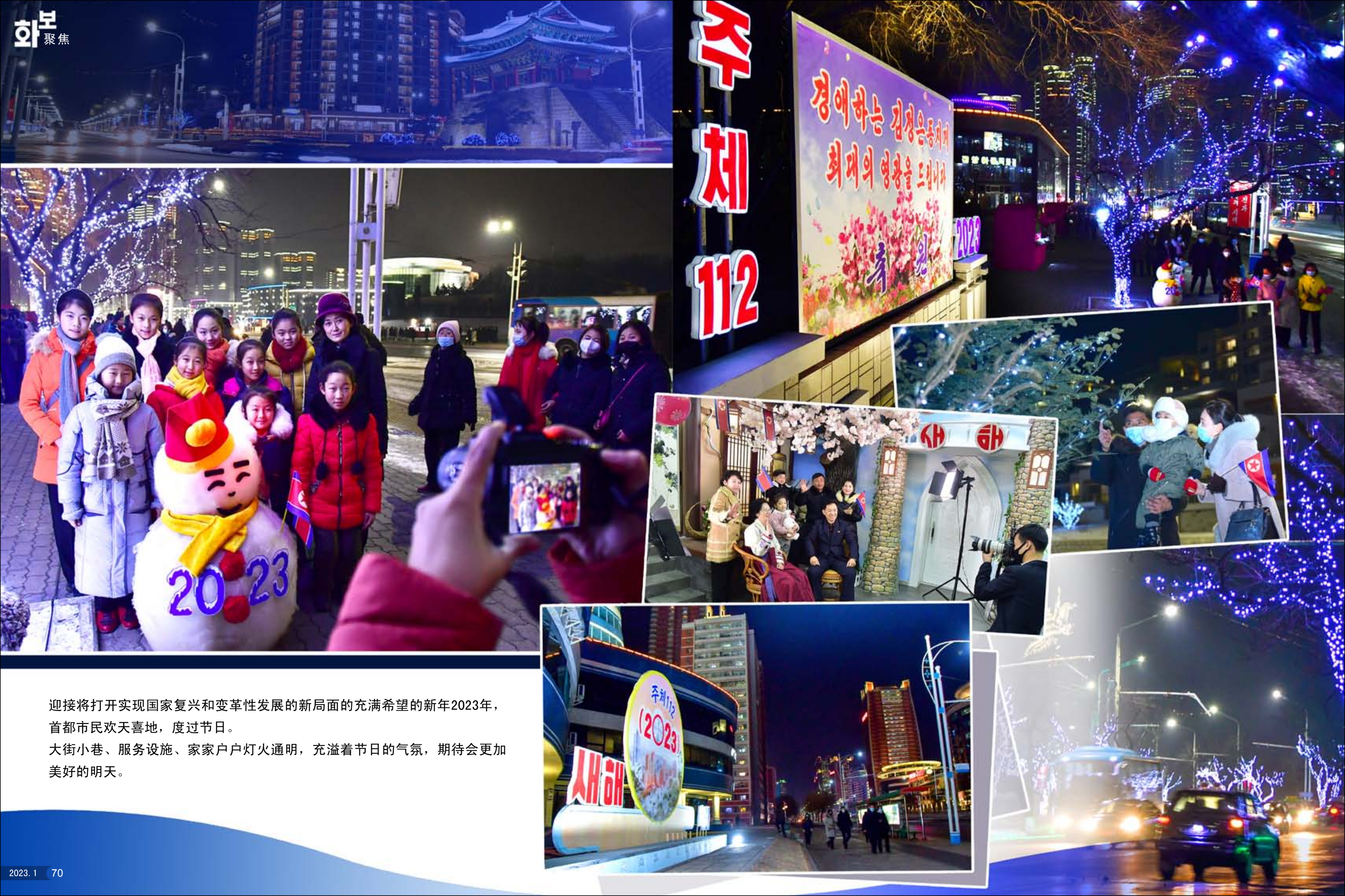
迎接将打开实现国家复兴和变革性发展的新局面的充满希望的新年2023年，首都市民欢天喜地，度过节日。 大街小巷、服务设施、家家户户灯火通明，充溢着节日的气氛，期待会更加美好的明天。