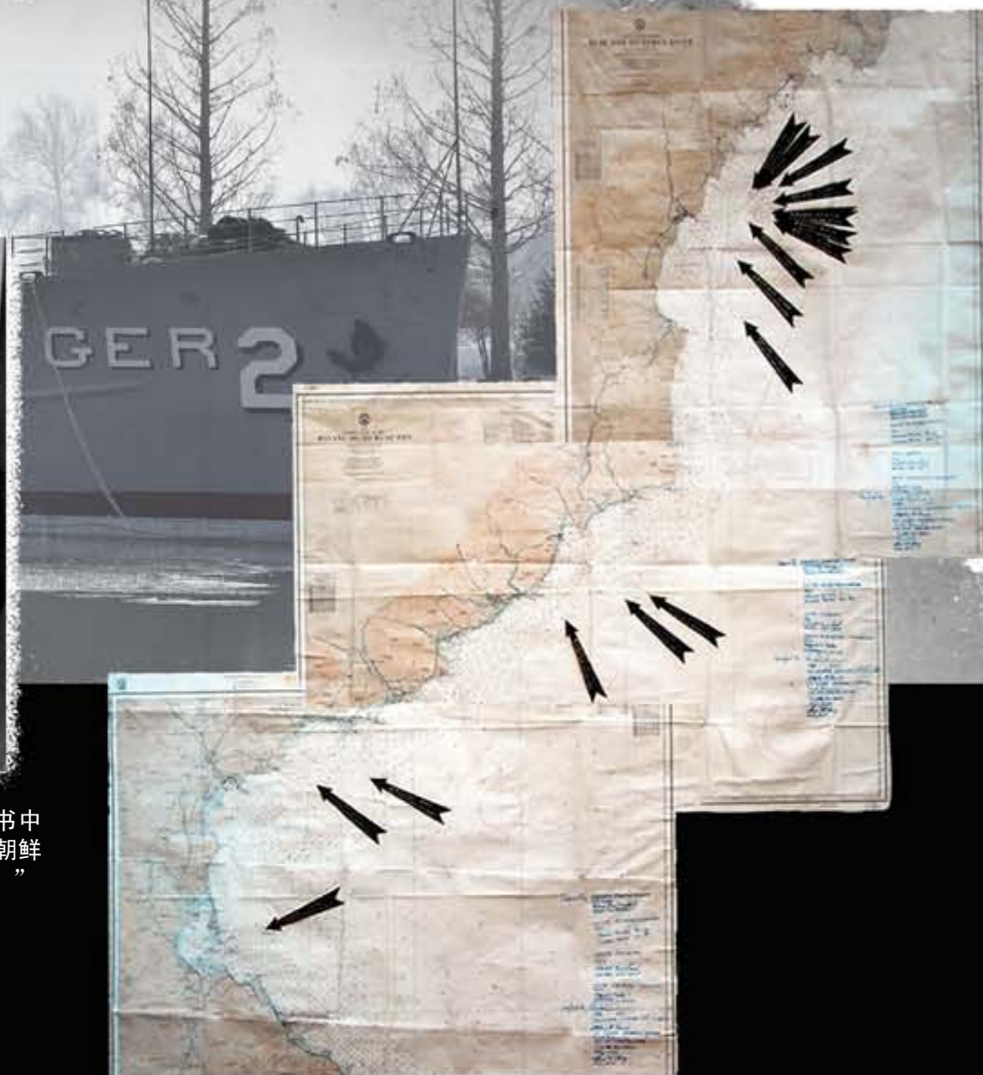
武装间谍船“普韦布洛”号侵入朝鲜民主主义人民共和国领海的地图