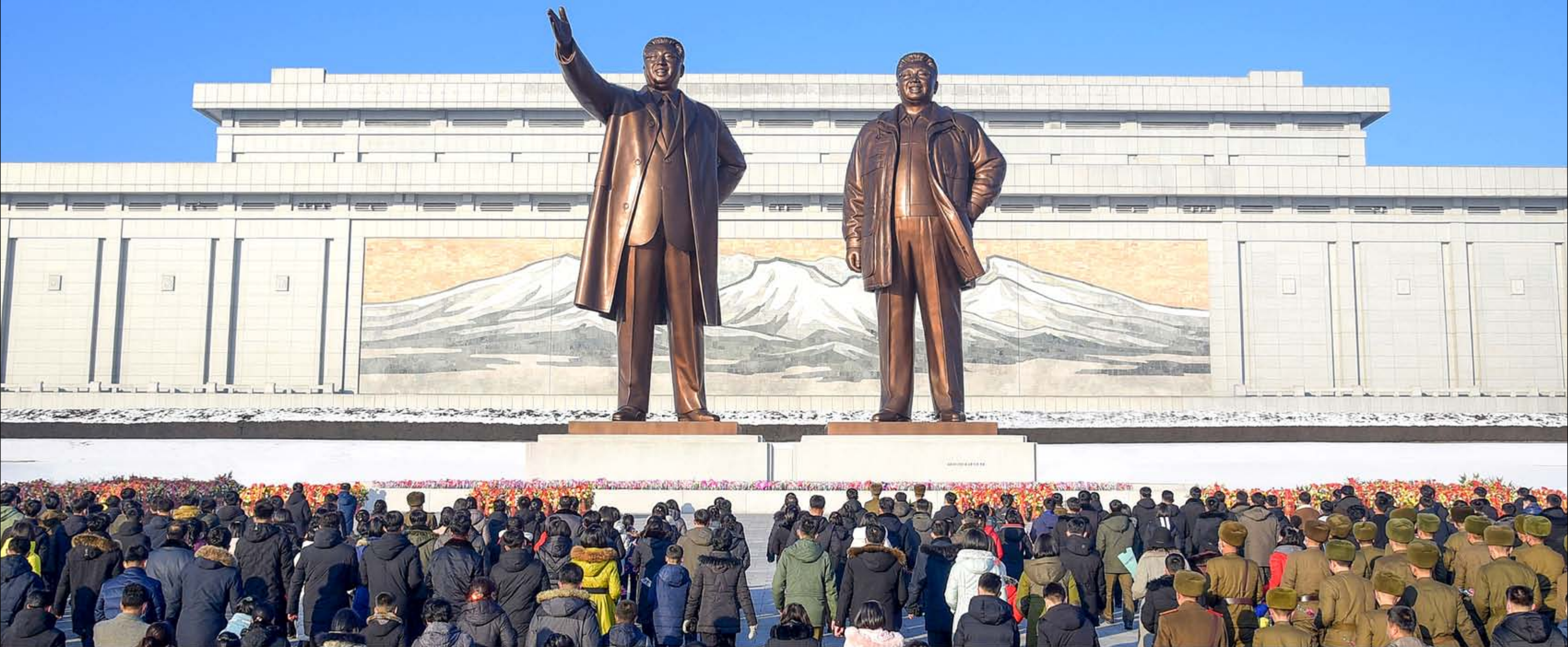
迎接2023年，干部、劳动群众、人民军官兵和青少年学生瞻仰矗立在万寿台岗上的金日成同志和金正日同志铜像敬献花篮和花束，鞠躬致敬。